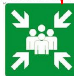
PUNTO DI RACCOLTA N. 1