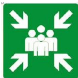
PUNTO DI RACCOLTA N. 2